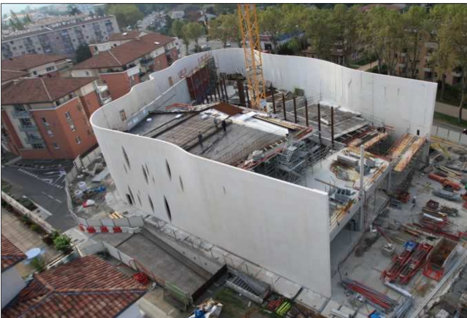
Exemple de construction de la médiathèque de Colomiers

Il peut travailler dans une entreprise artisanale, une PME ou dans une grande entreprise. Son activité requiert dès le départ une bonne connaissance des matériaux et de leur mise en œuvre, des matériels, des règles techniques et de sécurité. Il doit pouvoir mettre en œuvre des matériels de technologie avancée, effectuer les relevés des différentes parties d'ouvrage et prendre en compte les normes qualitatives et environnementales en vigueur.