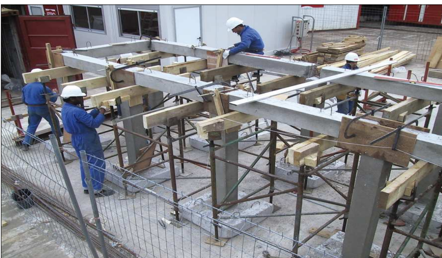
Exemple d'ouvrage en construction